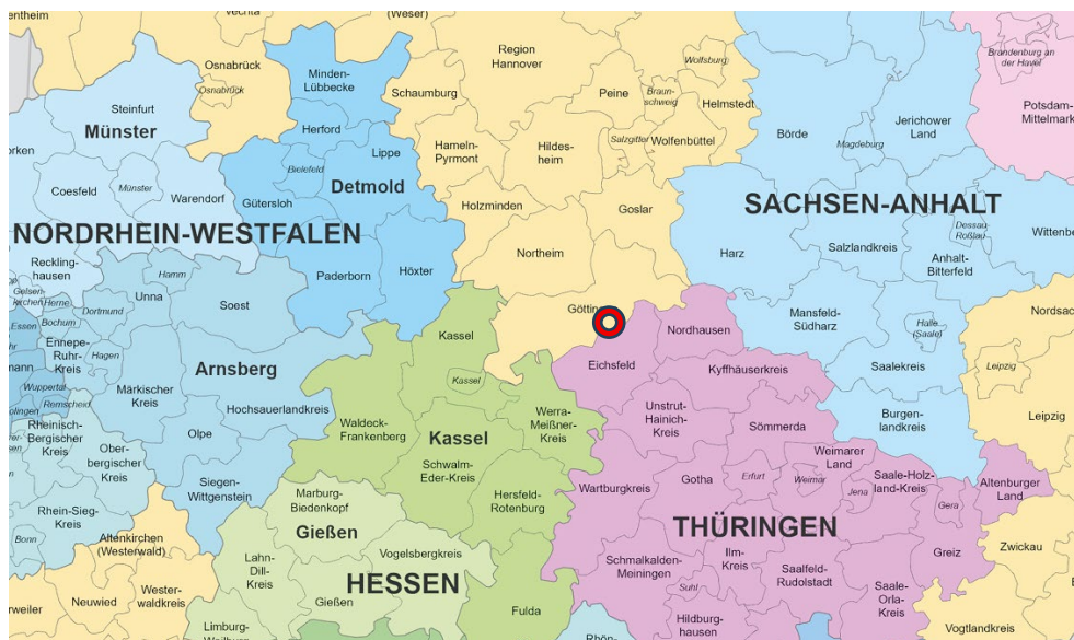
Lage im Raum